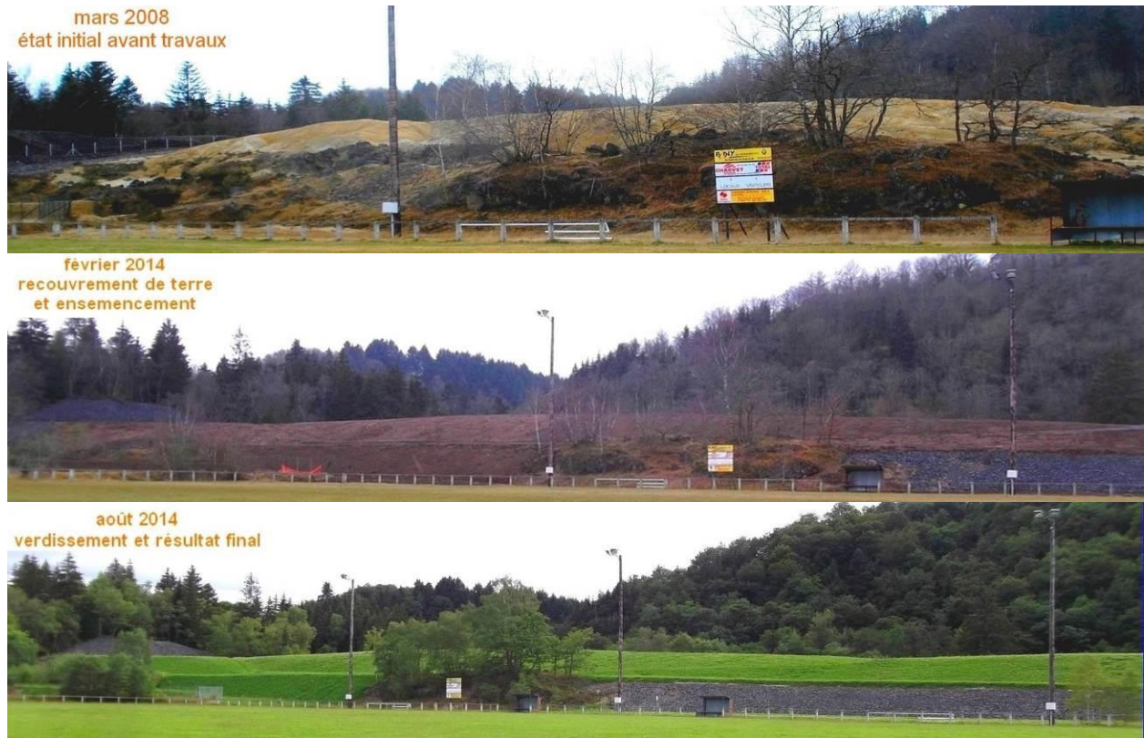
Figure 9. Évolution du site.

Il était prévu pour ce chantier de décaper les résidus sur l'ensemble du pourtour du site jusqu'au terrain naturel. Il s'est avéré que les reconnaissances initiales n'étaient pas exhaustives et auraient nécessité des fouilles plus systématiques. Côté ouest du site le long de la Sioule, l'épaisseur attendue était de l'ordre de 50 cm à 1 m or durant le chantier des matériaux identifiés comme pouvant être des boues de décantation ont été découverts sous les résidus. Après fouille, il s'est avéré qu'elles étaient présentes sur des épaisseurs dépassant 4 m. Leur comportement fortement thixotropique a fait prendre du retard au chantier et a nécessité une adaptation du projet et donc une surproduction.