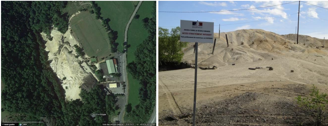
Figure 1. Vue aérienne du site des Fonderies avant les travaux. Figure 2. Vue du site des Fonderies avant les travaux en 2013.

métallurgiques non végétalisés, inertes et non lixiviés provenant de la part rejetée du minerai traité au sein de la fonderie (culots de four de taille centimétrique à décimétrique).