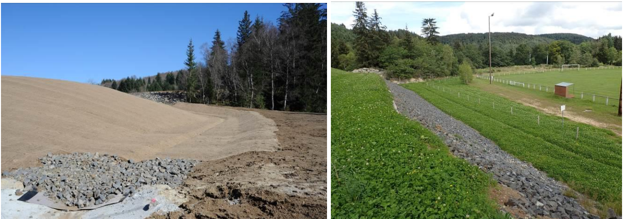
Figure 7. Dôme et fossé en mars 2014 (géomembrane, toile de jute, ...).

De fin mars à début avril 2014, l'amendement, l'ensemencement, la couverture géotextile en jute et les clôtures ont été mis en place.