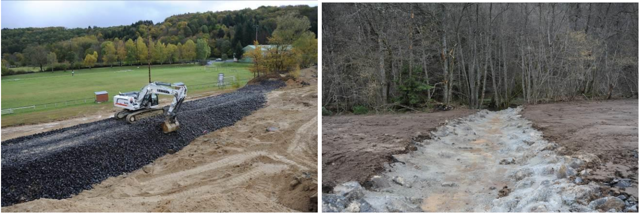
Figure 5. Remodelage (merlon en scories) côté stade.

Les scories et les blocs de basaltes du site ont permis de réaliser des merlons périphériques (fig. 5) ayant pour rôle le maintien des pentes du dôme et la prévention de l'érosion en cas de crue de la Sioule. La partie interne des merlons a été recouvert d'un géotextile pour laisser circuler l'eau mais éviter le transfert des résidus au travers.